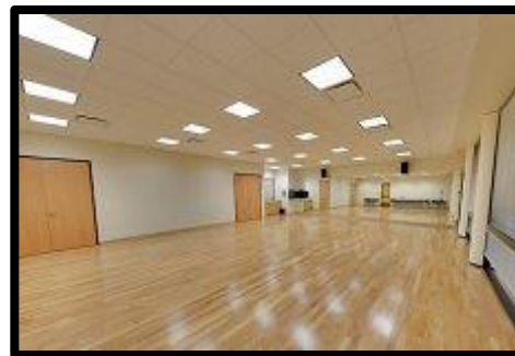
Salón 3 en la foto

* Configuración del salón en la parte de atrás