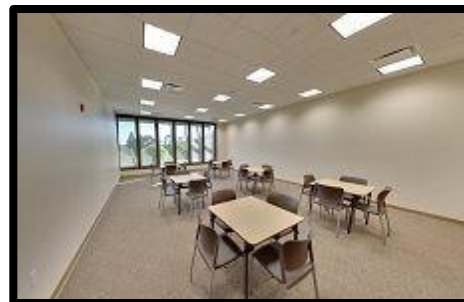
Salón 21 en la foto

Horas mínimas de alquilar son de 4 horas los sábados y domingos. Y mínimo de 2 horas todos los demás días de la semana.